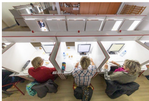
Figure 2. Exemple de cubicules servant aux analyses sensorielles

[...] Ainsi, les évaluateurs sont placés chacun dans un petit cubicule à l'intérieur d'une salle bien ventilée et bien isolée où le silence règne de façon monastique.